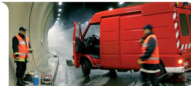
Exercice de désenfumage pour les Sapeurs-Pompiers

Deux mois avant sa récente mise en service, la voie souterraine Aurégia a fait l'objet dans la nuit du 22 septembre d'un test de désenfumage concluant, mené par le Corps des Sapeurs-Pompiers. Ce genre de test permet de valider les options de sécurité, au niveau des matériels et des techniques d'intervention. En l'occurrence, il s'agissait d'observer le fonctionnement du système de détection de foyer déclenchant l'extraction, par ventilation, des fumées produites par un « savant » mélange de féculé de pomme de terre, nitrate et lactose. Le désenfumage s'est révélé très performant. Parallèlement, un feu réel à l'heptane a été allumé pour tester un matériel