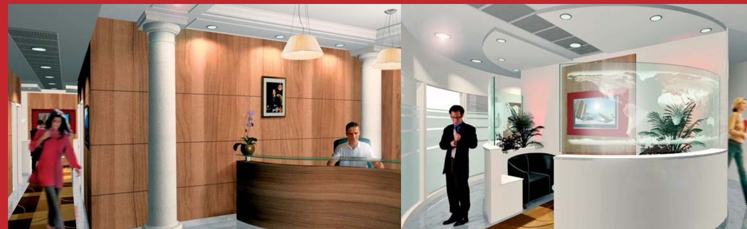
(Projet 3D des nouveaux locaux du DRE)