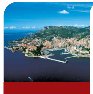
Un comité de l'innovation à la DTC