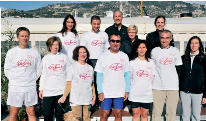
L'équipe de la Fonction Publique

Huit personnes travaillent aujourd'hui dans le service, équitablement réparties sur les 2 sites du Ministère d'Etat et de Fontvieille, créé en 2004, qui abrite la plus grande bibliothèque de droit de l'Administration monégasque. Responsable de la gestion globale des archives publiques, le service n'a pas pour autant renoncé au support « papier » : tous les documents originaux font l'objet d'une conservation sécurisée dans des locaux en partie réfrigérés, à l'intérieur de pochettes qui pour certaines d'entre elles peuvent résister au feu et à toutes sortes d'agressions extérieures.