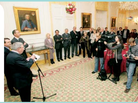
Les vœux du Ministre d'Etat (janvier 2008)

quotidien continu entre les médias et les institutions monégasques, au travers de conférences de presse, de communiqués ou bien d'interviews sollicités par les journalistes. Des échanges de qualité avec la presse, auxquels le Gouvernement Princier accorde beaucoup d'importance, comme en témoignera une nouvelle fois cette cérémonie annuelle. Ces vœux seront enfin l'occasion d'évoquer les moments forts de l'année écoulée et les perspectives qui se profilent à l'horizon 2009 en Principauté de Monaco.