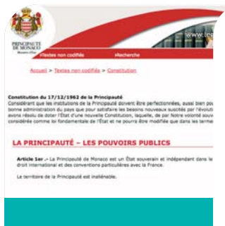
LégiMonaco en ligne