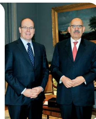
SAS le Prince Albert II et le D r El Baradei

La Principauté participe depuis longtemps aux activités de l'Agence Internationale de l'Energie Atomique, elle contribue à son budget et héberge depuis 1961 le Laboratoire de l'IAEA dédié à la protection de