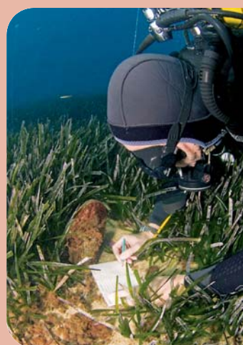
Etude des fonds marins