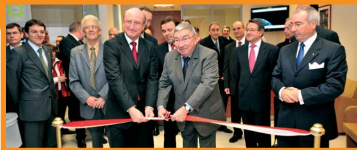
Inauguration de la nouvelle poste, le 10 décembre dernier.

La nouvelle Poste de la Condamine, rue Grimaldi est l'aboutissement d'un projet lancé suite à la reconfiguration du quartier de l'ancienne gare. L'immeuble de la rue de la Colle qui abritait l'ancien bureau de la Condamine doit être prochainement détruit. Au mois d'avril 2007,