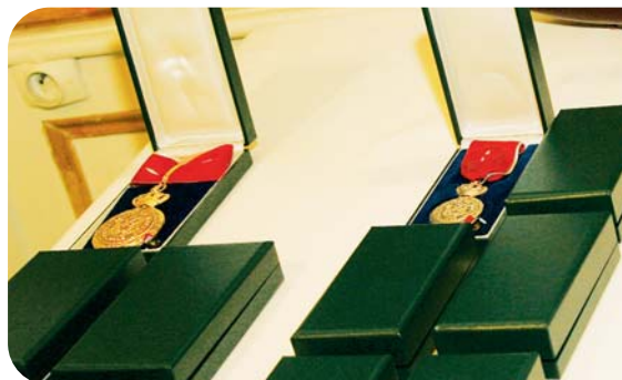
et Sportive, du Mérite National du Sang, de la Reconnaissance, décorations du Mérite Culturel, décorations dans les Ordres de Saint-Charles et de Grimaldi.