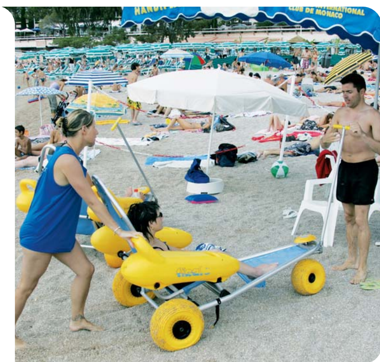
Le site Handiplage au Larvotto

confrontés sont très diverses : graves problèmes de délinquance, de maltraitance familiale, difficultés sociales et/ou physiques. Trois appartements d'accueil mère-enfant sont également prévus pour répondre à l'urgence de situations exceptionnelles.