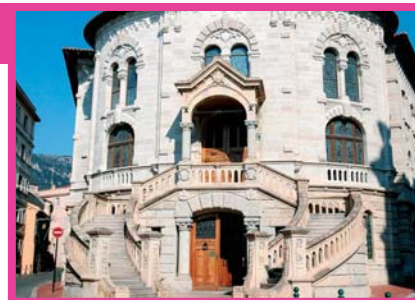
Le Palais de Justice

Le Secrétariat reçoit également le public sans rendez-vous, au 19 avenue des Castellans, pour divers renseignements concernant la procédure sans dispenser, en aucune manière, de conseil juridique. Du fait des procédures contradictoires devant le bureau de jugement, les délais peuvent parfois prendre près de 2 ans jusqu'à une décision. Les dossiers en instance sont ainsi en constante augmentation, preuve ici comme ailleurs d'un certain « engorgement » de la justice.