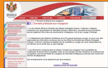
Le site des Relations Extérieures

la liste des ambassades et consulats de Monaco et vers le site officiel du Ministère des Affaires étrangères et européennes français. Ces pages ont vocation à renseigner les ressortissants étrangers désirant se rendre à Monaco et les Monégasques se rendant à l'étranger. Pour le Bénin, en tout cas, il faudra un Visa.