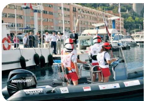
L'équipe de Monaco