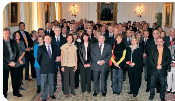
Remise de médailles au Ministère d'Etat en novembre 2008.

(*) Médailles du Travail, d'Honneur, de l'Education Physique