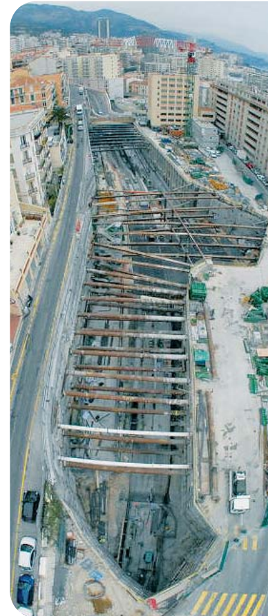
Les travaux en cours de la dorsale

L'urbanisation des terrains de l'ancienne voie ferrée se poursuit à la fois en surface avec la construction de logements, de bâtiments publics et de planchers d'activités, mais aussi en profondeur avec la mise en souterrain de la dorsale routière, prolongement du boulevard du Larotto. La construction de cette voie souterraine est réalisée par phase, correspondant aux liaisons inter-quartiers. La première étape a été livrée en 2002 sur l'îlot Aurégli-Grimaldi. A ce jour, le réseau de la dorsale souterraine est réalisé à 50 %. La prochaine étape sera très prochainement mise en service, dans la dernière semaine du mois de décembre. Réalisée sur les îlots Rainier III et Canton, elle assurera le raccordement du boulevard du Larotto, via le rond point Aurégli, au tunnel Rainier III en direction de la moyenne comiche. Pour cette étape, le montant des travaux de génie civil est de 29 millions d'euros (valeur 2007). Toujours sur ce même îlot, l'opération se poursuivra par la réalisation d'un rond point souterrain afin d'assurer les liaisons vers le quartier de Fontvieille et vers le quartier du Port. Parallèlement, la dernière étape sur l'îlot Pasteur assurera, par un tunnel, la liaison entre la dorsale et la basse comiche à l'Ouest de la Principauté. Ce sera la 5 e et dernière phase de cette infrastructure routière à double-sens reliant, fin 2010, l'Est et l'Ouest de la Principauté.