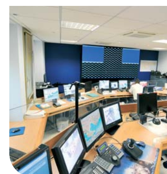
Le nouveau centre de commandement