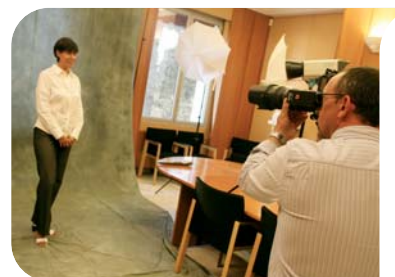
Prises de vue au Ministère d'État

Les chefs de service et leurs adjoints y sont (presque) tous passés. En juillet et en septembre, lors de deux sessions de 2 et 4 jours, le photographe du Centre de Presse Charly Gallo a pris 89 portraits en vue de réaliser ce « trombinoscope ». Les photos ont été prises dans la petite salle du Ministère d'État, où un studio avait été installé, au Centre de Presse et en extérieur dans les jardins. Elles complètent la banque de données visuelle destinée à alimenter les sites internet et les publications du Gouvernement, et répondre, si nécessaire, aux demandes formulées par la presse.