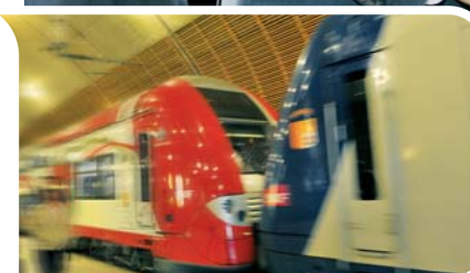
Le 19 septembre SAS le Prince Albert II et Jean-Louis Borloo ont inauguré la première rame de TER aux couleurs monégasques.