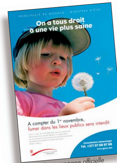
La campagne officielle

Elle donne enfin à la Direction du Travail les outils pour mener à bien ses missions de vérifications et d'arbitrage. Dans l'administration, 3 jeunes bénéficient depuis septembre 2008 de ces avantages : deux apprentis jardiniers au SDAU, issus du Centre de formation des métiers horticoles d'Antibes et un mécanicien au garage de la Sûreté Publique, venu de l'Institut de formation automobile de Nice. Ayant le statut de salariés, ils ont droit quand ils sont âgés de moins de 18 ans à une rémunération fixée à 50 % de l'indice de base de la Fonction Publique ; lorsqu'ils sont âgés de 18 ans et plus, ils perçoivent une rémunération correspondant à 75 % dudit indice. Du fait de l'allongement constant des études, tous les métiers sont ainsi concernés, du CAP à Bac+5, pour offrir aux jeunes cette indispensable immersion dans le monde du travail.