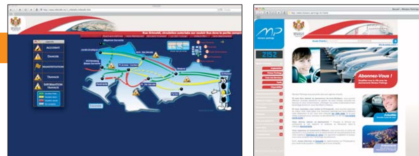
Les sites internet du centre de régulation du trafic et des parkings publics

ce qui peut avoir une incidence sur les déplacements en Principauté (accident, travaux, danger, manifestation...). La consultation de la carte principale est claire, et la navigation très simple. La rubrique Flash Info dresse la liste très précise des changements affectant plus durablement la circulation. La sécurité des tunnels fait l'objet d'une rubrique distincte et l'Espace Pro, accessible après identification, enregistre les demandes d'occupation de la voie publique pour les chantiers. 1000 connections avaient été enregistrées sur le nouveau site, deux mois après son lancement.