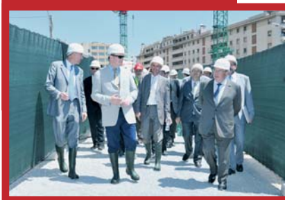
Visite du chantier du réseau routier souterrain par le Prince Albert II, le 23 juin dernier