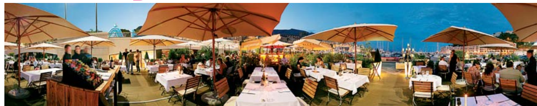
Un nouvel espace face au port Hercule